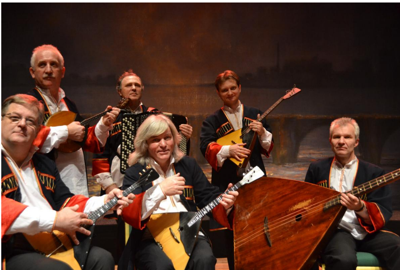
Instrumental Soloists Ensemble "Pilharmonia"

Tot nu toe zijn de instrumentalisten (het Instrumental Soloists Ensemble 'Pilharmonia') nauwelijks aan de orde geweest. Deze groep die bestaat uit zeer bekende- en geliefde artiesten in Rusland behoeft op artistiek-inhoudelijke terrein weinig extra aandacht, omdat allen laureaten zijn en buitengewoon virtuoos zijn in het bespelen van hun instrument, De instrumentalisten bespelen de traditionele Russische volksinstrumenten, de Balalaika (prima, alt en bas balalaika), de Domra (eveneens als balalaika een snaarinstrument, dat gespeeld wordt met een plectrum), de Bayan (bij ons beter bekend als de accordeon). Incidenteel wordt ook gebruik gemaakt van een piano en/of synthesizer als aanvullend instrument. Tijdens het concert geeft de dirigent uitleg over deze instrumenten en laat ze ook afzonderlijk horen. Daarnaast spelen zowel de Domra, Bayan, als ook de Balalaika solowerken begeleid door het ensemble. Ook de solofunctie tijdens het begeleiden van de vocale werken is van groot belang. Vaak vormen zij dan een tegenmelodie, waardoor de instrumenten niet alleen een begeleidende functie hebben, maar koor en ensemble beiden even belangrijk zijn.