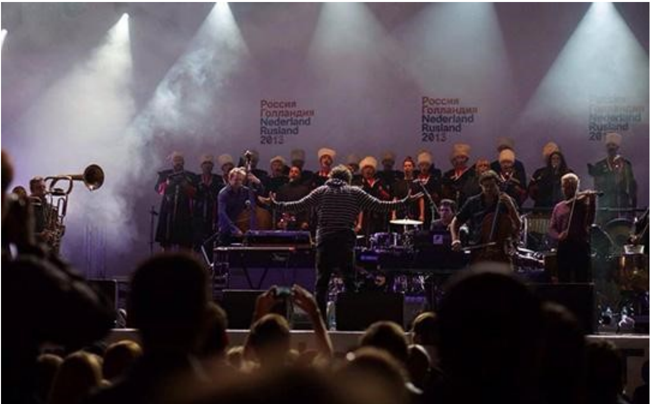
Don KosakenChor Rusland/The Voices of Russia tijdens de Live-performance in Gorkipark, Moscow september 2013