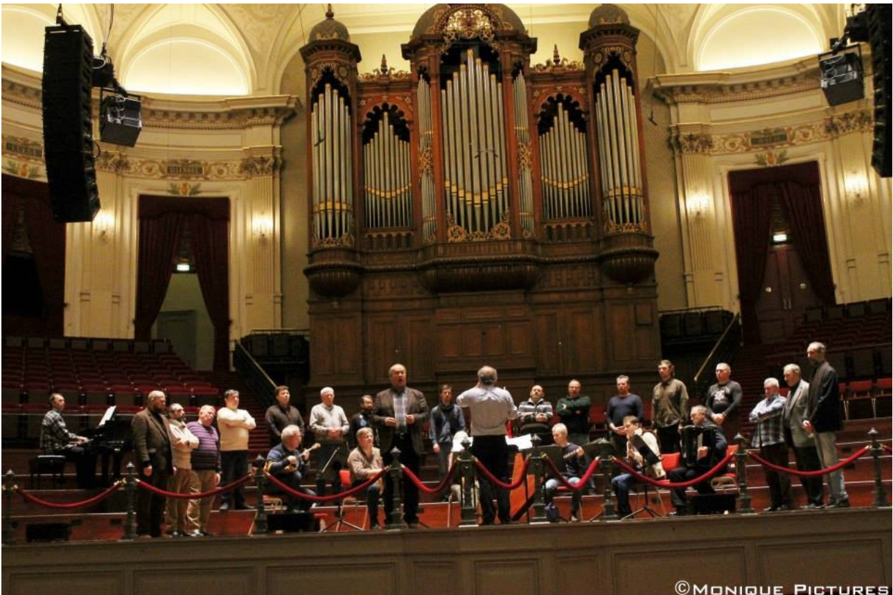
Repetitie, Concertgebouw Amsterdam, zondag 21 december 2014

alleen in grote zalen op, zoals het Concertgebouw in Amsterdam, Liederhalle in Stuttgart, OCC in Berlin en het concertgebouw “de Vereeniging” in Nijmegen, maar kiest zij juist ook voor de kleinere zalen in Europa. Ook al zijn sommige, kleine(re) zalen financieel niet rendabel, acht de artistieke leiding het voor realisering van de doelstellingen van groot belang om in kleinere plaatsen te concerner. Juist dit publiek dat vaak niet in staat is om naar de podia in de grote steden te reizen, komt steeds minder in aanraking met kunst en cultuur in brede zin, omdat steeds meer professionele gezelschappen ‘kleinere’ podia mijden. Niet alleen het musiceren, maar juist ook de communicatie met het publiek, is van belang voor de verbreding van de Russische muziek en cultuur. De Nederlandse dirigent geeft het publiek achtergrondinformatie en uitleg over de uit te voeren werken. Ervaringen hebben geleerd, dat dit door het publiek enorm wordt gewaardeerd.