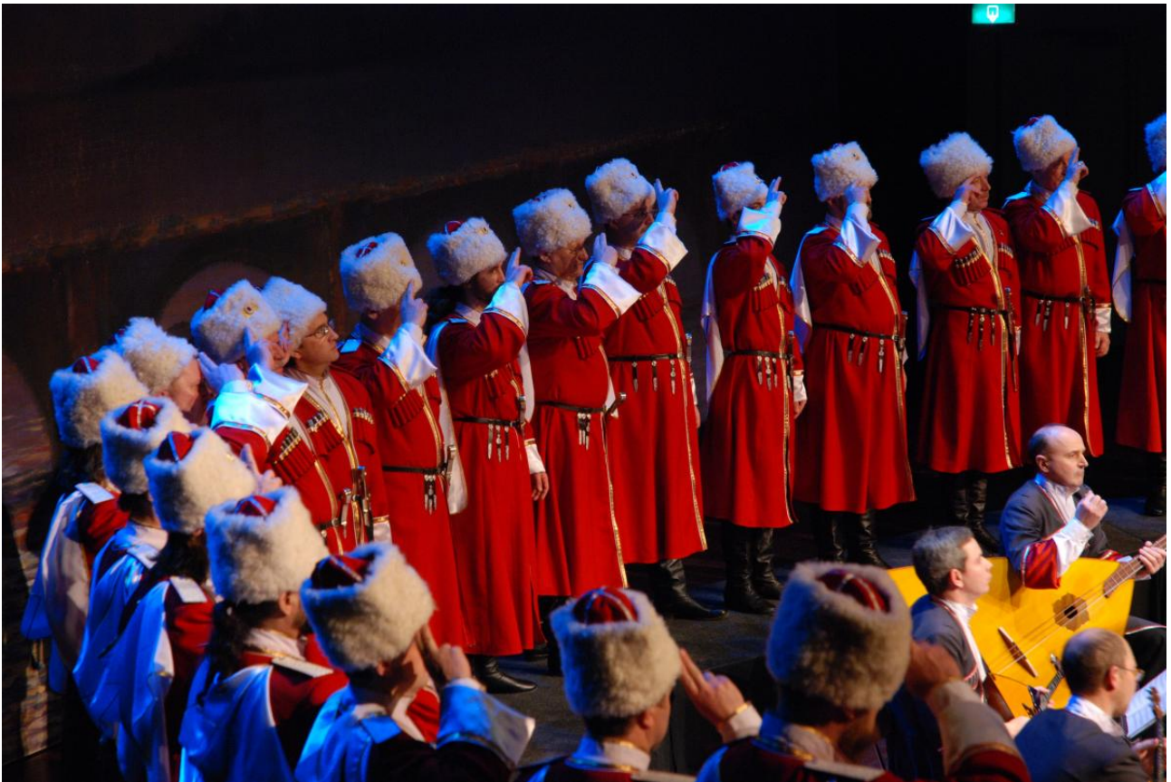
Uniformen Don KosakenChor Russland

De wezenlijke kenmerken dienen niet alleen in de keuze van het repertoire maar ook in de uniformen, de presentatie op het toneel en in alle publicaties en andere uitingen duidelijk naar voren te komen. Dat betekent onder meer dat het noodzakelijk is om op termijn nieuwe kostuums aan te schaffen. Een dergelijke belangrijke aankoop dient idealiter te passen in een nieuwe huisstijl waar het imago en de identiteit van het koor elkaar zoveel mogelijk raken. In nauw overleg met het Rusland-Nederland Centrum en de Rijksuniversiteit van Groningen wordt op basis van het repertoire gezocht naar de juiste documentaires en/of Russische filmfragmenten die tijdens de concerten deel gaan uitmaken van de productie.